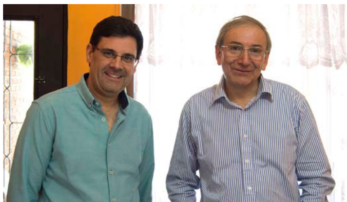
Agencia Bella Unión (27 de abril de 2018).