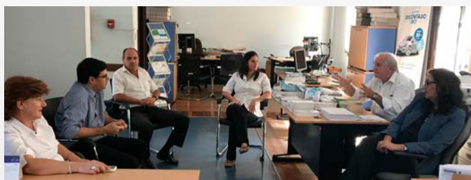
Sucursal Paysandú (26 de abril de 2018).