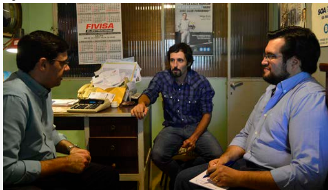
Agencia Chapicuy (27 de abril de 2018).