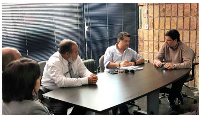
Sucursal Rocha (11 de mayo de 2018).