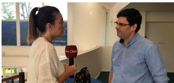
Prensa Encuentro regional este (11 de mayo de 2018).

Destaqué el desafío que tenemos como banco en un mercado en competencia, la que nos obliga a mejorar día a día. Evalué positivamente que hace más de 20 años se abriera el mercado de los seguros. Competimos con multinacionales, lo que provoca que brindemos servicios de mayor calidad a precios más competitivos.