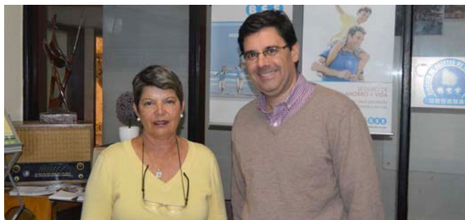
Agencia Chuy (11 de mayo de 2018).

Mi compromiso es servir al país, dando lo mejor que tenemos y contribuyendo a que el BSE siga siendo una empresa competitiva, sólida y firme al servicio de los uruguayos.