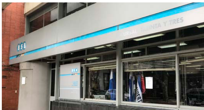
Sucursal Treinta y Tres (10 de mayo de 2018).