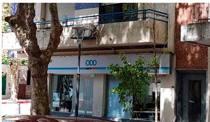
Sucursal Durazno (22 de marzo de 2018).