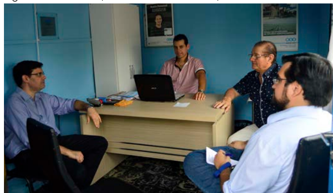
Agencia Quebracho (26 de abril de 2018).