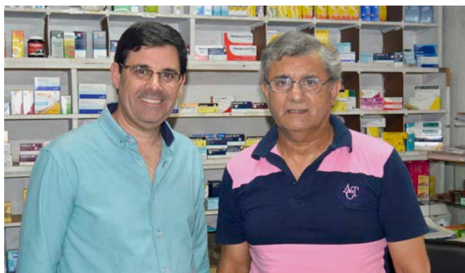
Agencia Baltasar Brum (27 de abril de 2018).