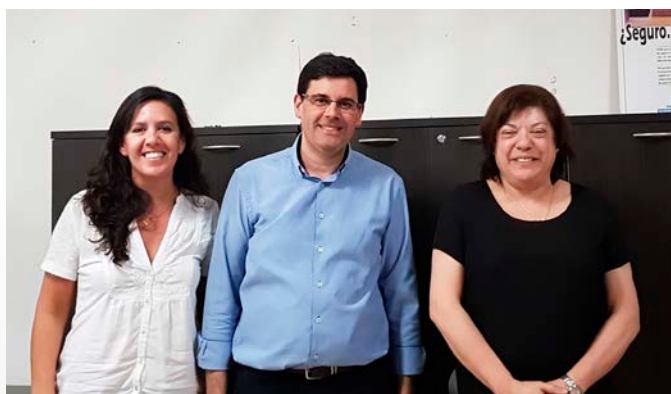
Sucursal Trinidad (22 de marzo de 2018).