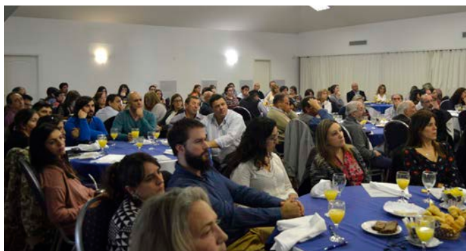
Encuentro Regional Este (Punta del Este, 11 de mayo de 2018).