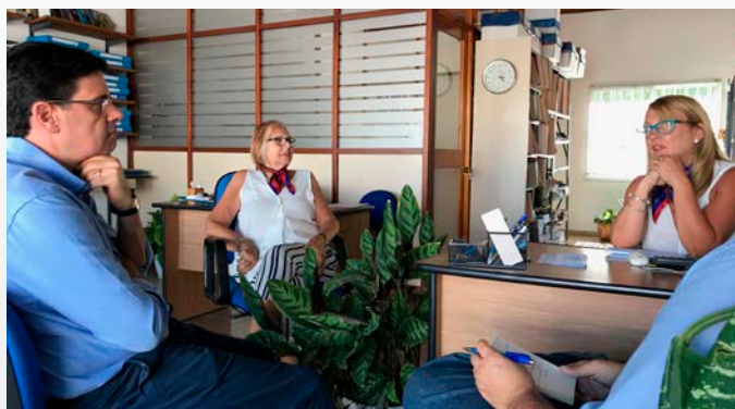
Agencia Ombúes de Lavalle (8 de marzo de 2018).