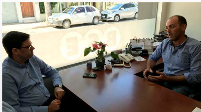
Agencia Nueva Helvecia (8 de marzo de 2018).