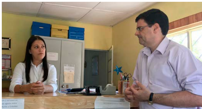
Agencia San Javier (9 de marzo de 2018).

Las respuestas han sido positivas. Se destaca la posibilidad de entablar el contacto directo, de actuar para resolver los problemas que requiere el cliente en el primer nivel de atención. A su vez para nosotros es una forma de transmitir el compromiso de nuestra gestión, apostando con energía al futuro.