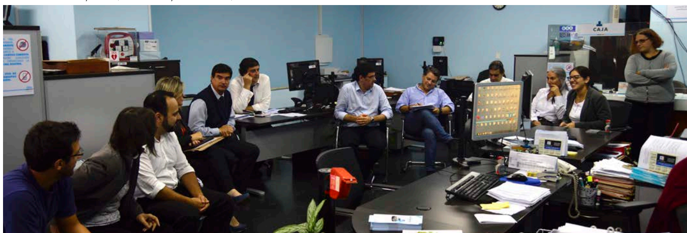
Sucursal Melo (10 de mayo de 2018).