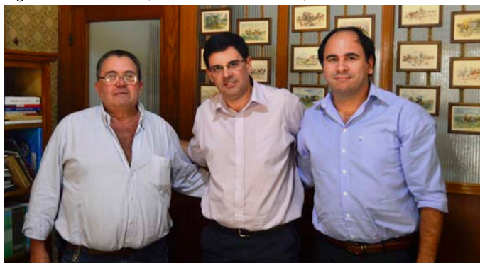
Agencia Young (9 de marzo de 2018).