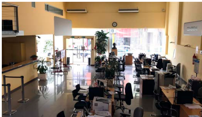
Sucursal Salto (27 de abril de 2018).