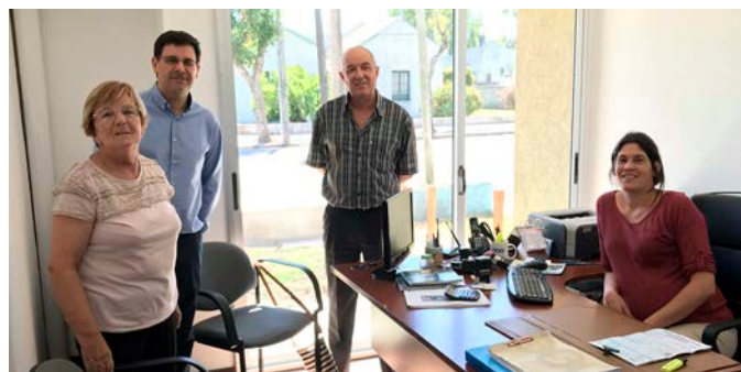
Agencia Colonia Miguelete (8 de marzo de 2018).