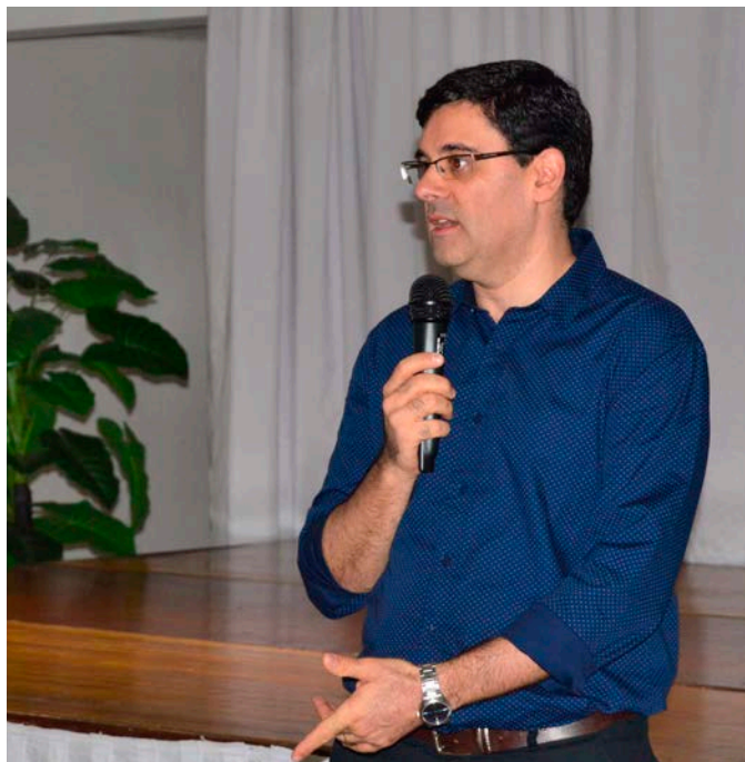
Encuentro Regional Norte (Paysandú, 9 de marzo de 2018).