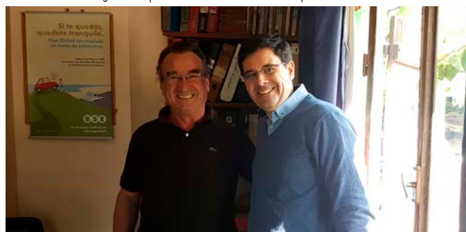
Agencia Isla Mala (22 de marzo de 2018).