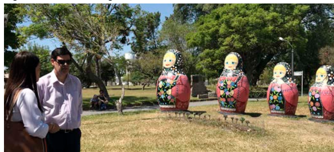
Plaza de San Javier (9 de marzo de 2018).