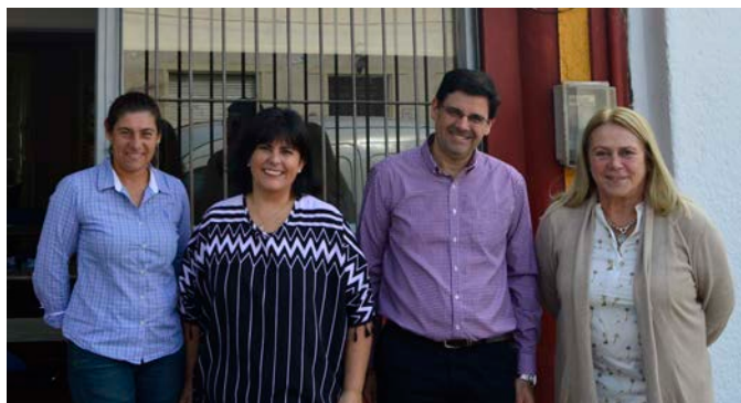
Agencia Lascano (11 de mayo de 2018).