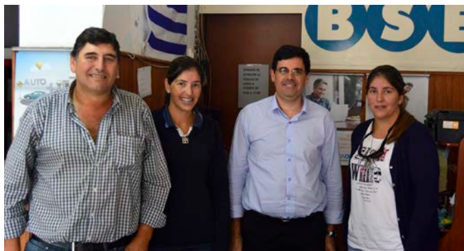
Agencia José Pedro Varela (10 de mayo de 2018).