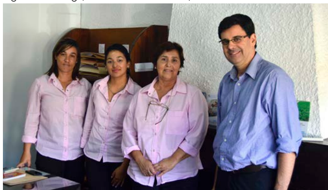
Agencia Guichón (26 de abril de 2018).