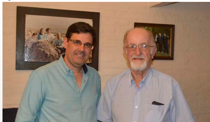
Agencia Villa Constitución (27 de abril de 2018).